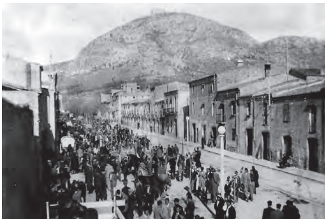
Fira de Sant Andreu al passeig de Catalunya

En la seva 23a edició, no et perdís aquesta cita ineludible amb la història i els racons de Torroella!!!